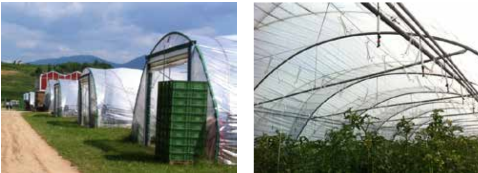
Abbildung 3-7: Tomatenanbau in Folientunneln in Süddeutschland