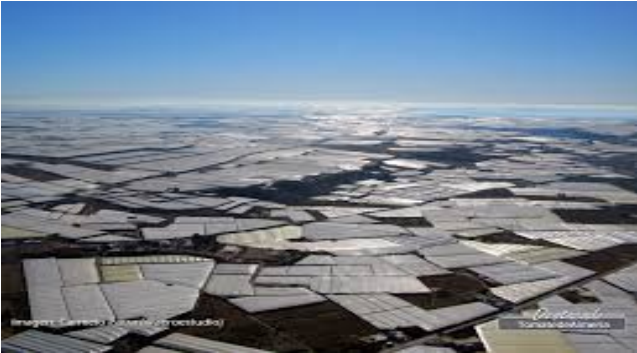
Abbildung 3-6: Tomatengewächshäuser in El Ejido, Provinz Almería (Mar del Plástico)