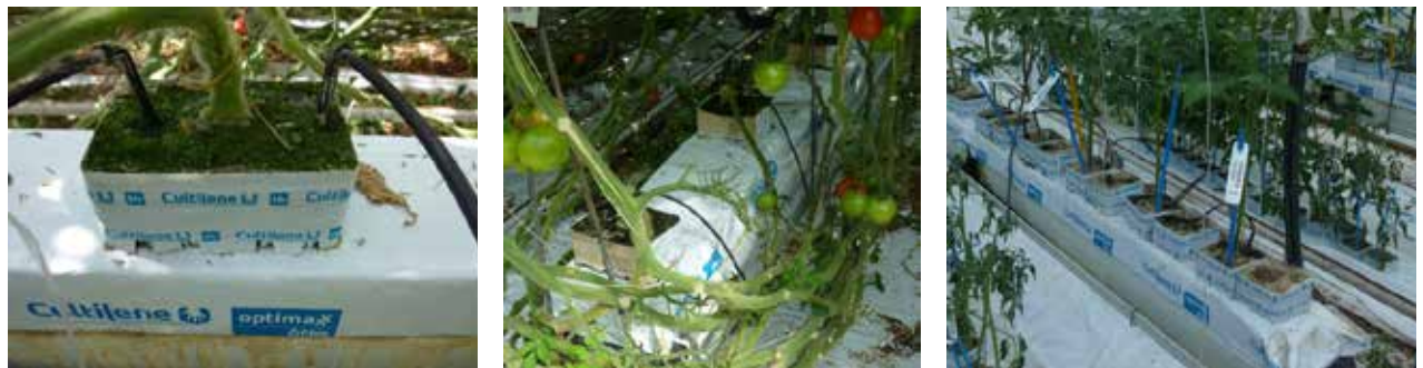
Abbildung 3-4: Tomatenanbau auf Substrat mit computergestützter Zulieferung von Wasser und Nährstoffen