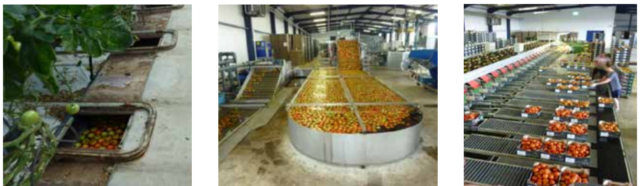
Abbildung 3-5: In den meisten niederländischen Betrieben werden die Tomaten automatisch gesammelt und in die Packbetriebe transportiert, wo sie gewaschen und verpackt werden

Der Transport der Tomaten von den Gewächshäusern zu den Packstationen sowie das Waschen und Verpacken der Ernte erfolgt in den niederländischen Betrieben in der Regel hoch automatisiert (vgl. Abbildung 3-5). Die Betriebsgrößen in den Niederlanden liegen im konventionellen Anbau zwischen 2 und 10 ha, im Bio-Anbau zwischen 2 und 5 ha.