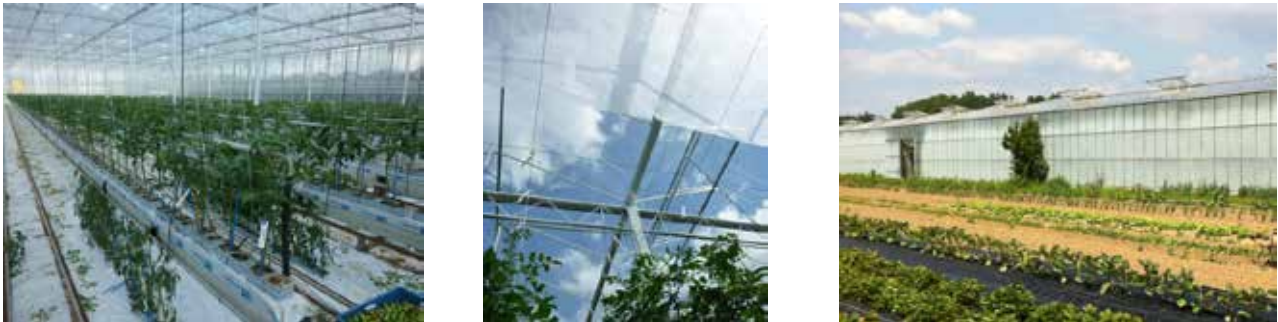
Abbildung 3-3: Tomatenanbau in Glas-Gewächshäusern in den Niederlanden

angeschlossen, die den Strombedarf der Betriebe sowie 90 % des Wärmebedarfs der Gewächshäuser bereitstellen. Der übrige Strom wird ins öffentliche Stromnetz eingespeist.